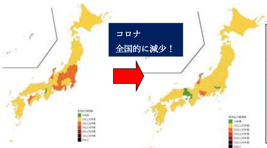
コロナ 定点あたりの報告数